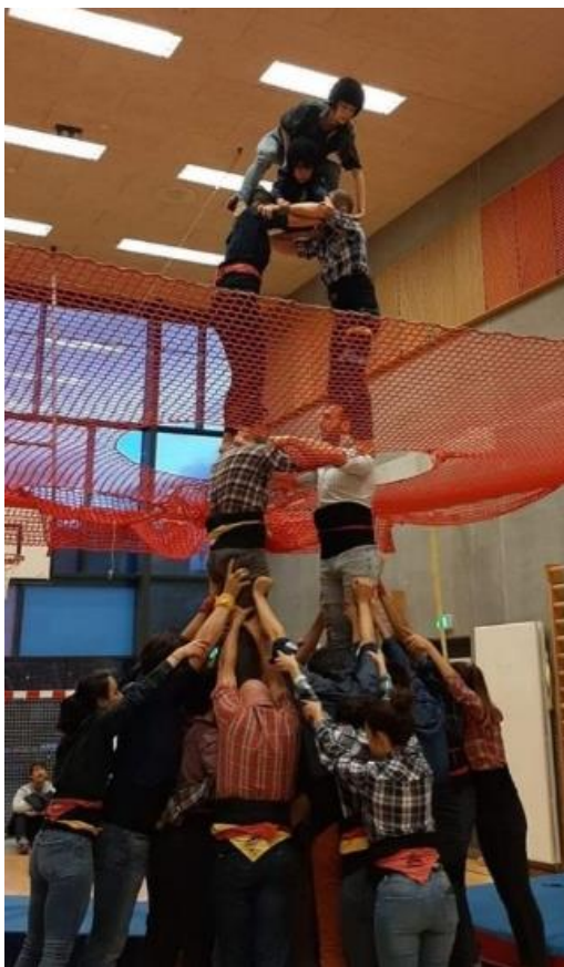
Assaig d’un 2 de 5 dels Xiquets de Copenhagen el 7 de novembre de 2021

Segons la Júlia, el fet de conèixer a gent en una colla castellera uneix més o crea més vincles que si la coneixes en un altre espai, com ara la feina. Ens parla que una de les causes d’això és