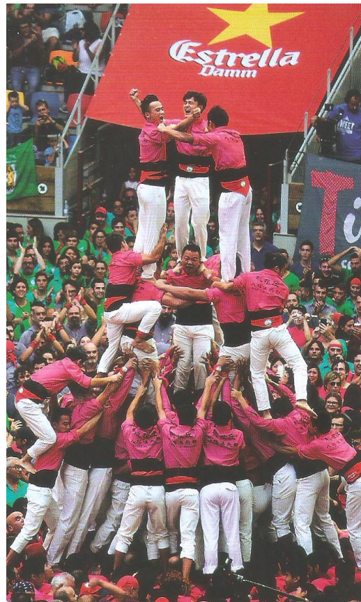
Moment en què els Xiquets de Hangzhou descarreguen el 3 de 9 amb folre pel Concurs de Castells de 2016

Malgrat això, després del Concurs de 2016 la intensitat dels de Hangzhou va baixar. Antex va experimentar una gran expansió empresarial que va provocar que una part important dels treballadors que pujaven als castells de 8 o de 9 s'haguessin de traslladar, fet que van suposar la frenada de la seva ascensió fulgurant (Bertran et al., 2019: 151). A més, des de l'arribada de la Covid-19, els Xiquets de Hangzhou han aturat tota la seva activitat.