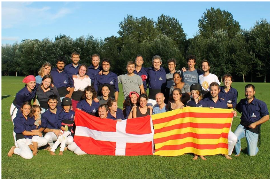
Foto conjunta dels Xiquets de Copenhagen en motiu de l’11 de setembre de 2016