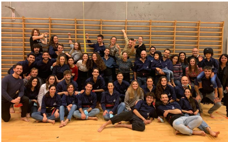
Foto conjunta dels Xiquets de Copenhagen al finalitzar un assaig el 20 de novembre de 2021